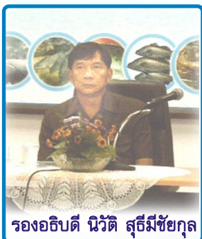
รองอธิบดี นิวัติ สุธีมีชัยกุล

เมื่อวันจันทร์ที่ 7 พฤศจิกายน 2548 ท่านรองอธิบดี นิวัติ สุธีมีชัยกุล และคณะ ได้แวะเยี่ยมเยียนสถาบันวิจัยการเพาะเลี้ยงสัตว์น้ำชายฝั่ง ในโอกาสที่มาประชุมหัวหน้าส่วนราชการในเขตตรวจราชการที่ 19 (สงขลา-สตูล) โดยผู้อำนวยการและข้าราชการสถาบันฯ ให้การต้อนรับ โดยสถาบันฯ ได้นำเสนอสรุปผลการดำเนินงานโครงการฟื้นฟูทรัพยากรประมงในทะเลสาบสงขลาปี 2548 ผลการดำเนินงาน